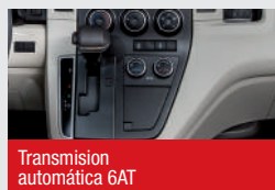
Transmisión automática 6AT