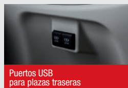
Puertos USB para plazas traseras