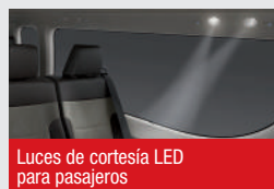
Luces de cortesía LED para pasajeros