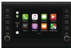
Pantalla táctil de 8" con Apple CarPlay® y Android Auto® (***)