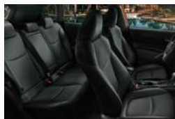
Asientos tapizados en cuero natural y ecológico (**)