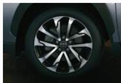
Llantas de aleación de 18" (**)