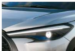
Faros delanteros Bi-LED con regulación en altura (*) (***)