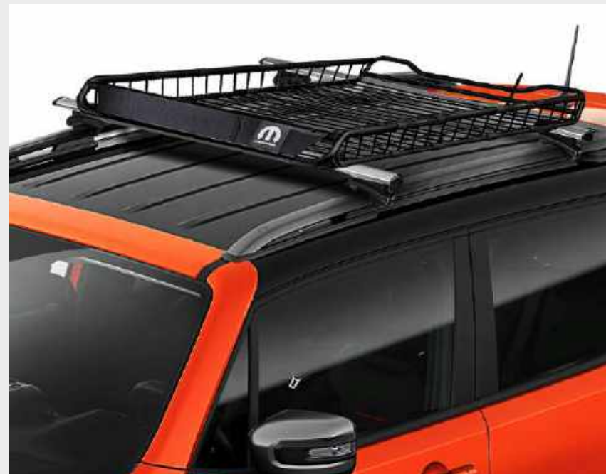
Parrilla portaequipaje MOPAR