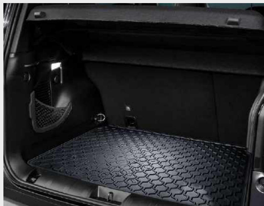
Alfombra baúl Longitude