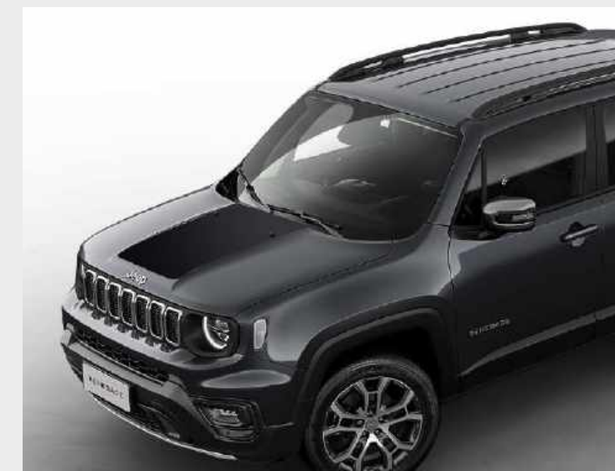
Adhesivo antirreflejo Longitude