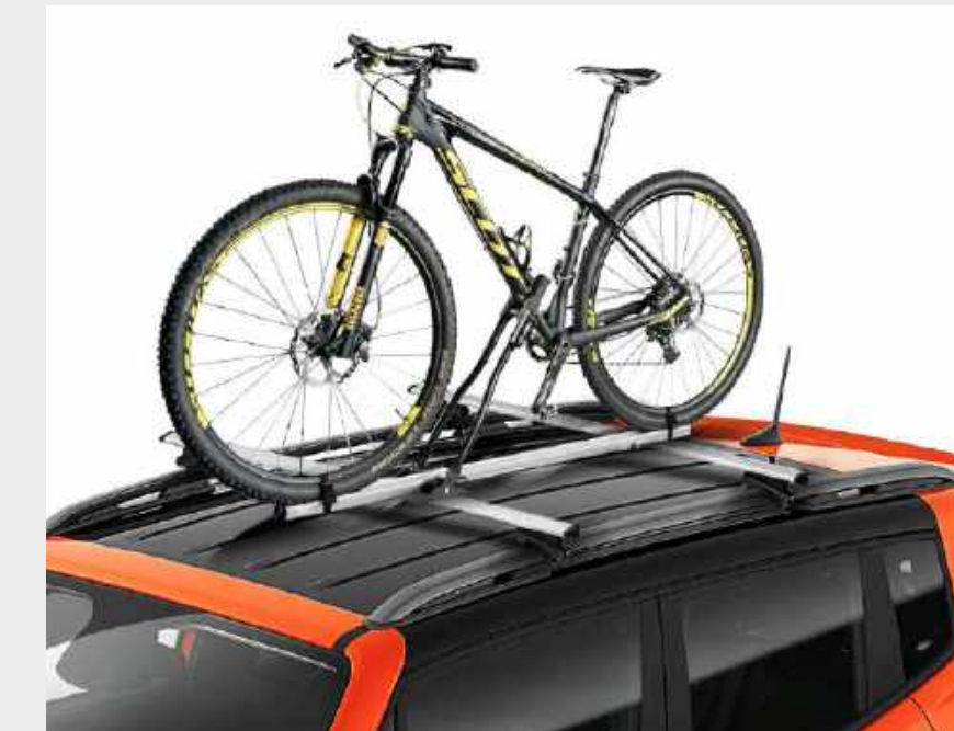
Soporte de bicicleta para techo