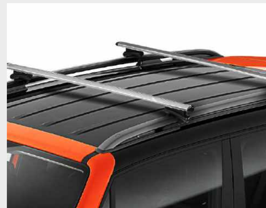
Barra transversal de techo par